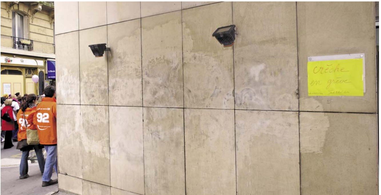
Le décompte des heures de grève diffère dans les fonctions publiques d'Etat et Territoriale

blissement ou de l'organisme intéressé » (24) :